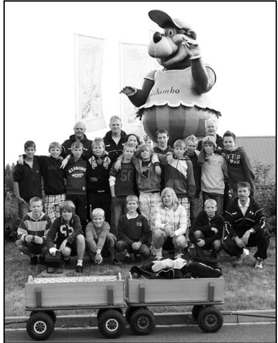
JSG ACN 1. D-Jugend