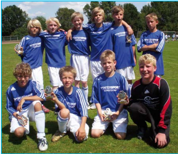
Die 1. E der JSG ACN