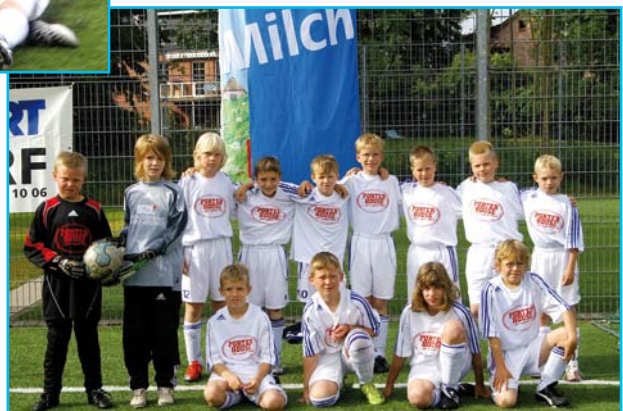
Die 2. E der JSG ACN

Dann allerdings wird der HANSANO-CUP 2010 auf dem 11er Feld ausgetragen.