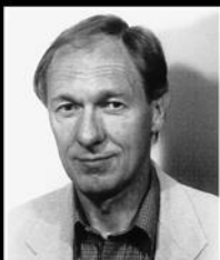
Ein Freund des Sports berät Sie in allen Küchenfragen